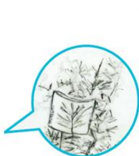
Bispo art & craft