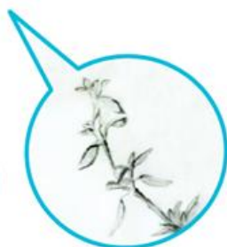
Stirpe Pittura botanica